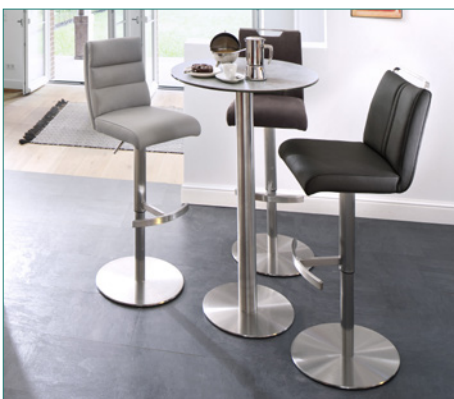
Barstuhl GIULLIA mit Tisch ZARINA 1

Feingewebe Romeo 1005104 anthrazit 1005105 braun 1005106 eisgrau Nubukleder-Optik Belvedere 1005107 anthrazit 1005108 braun 1005109 eisgrau Nubukleder-Optik Belvedere 1005101 anthrazit 1005102 braun 1005103 eisgrau