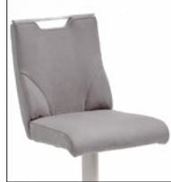
Ausführung C mit Griffloch