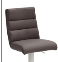
Ausführung B mit Griff hinten