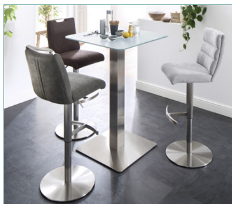
Barstuhl GIULLIA mit Tisch ZARINA 2