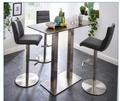
Barstuhl GIULLIA mit Tisch ZARINA 3