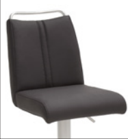
Ausführung A mit Griffleiste