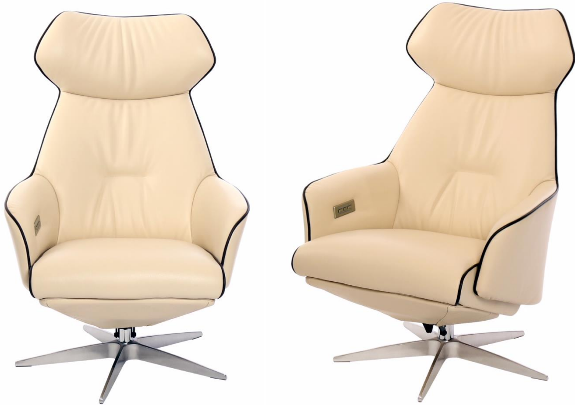
Abgebildet Modell - ARC