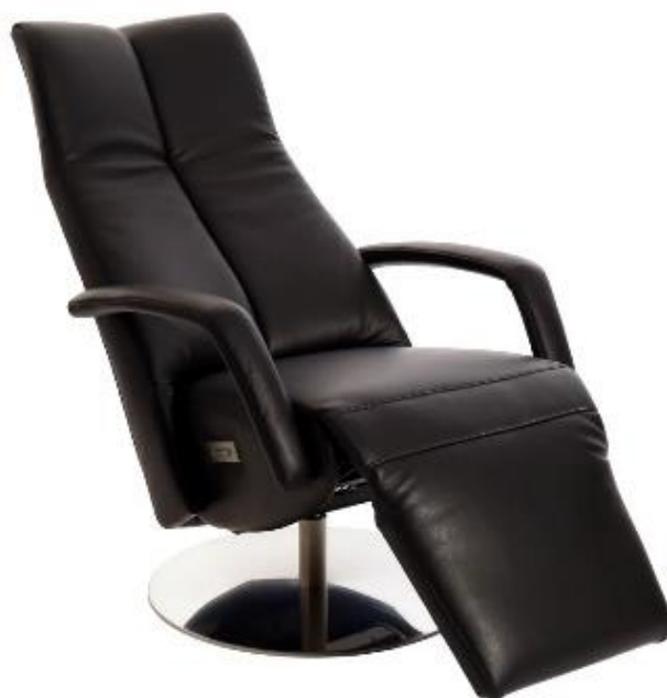
Abgebildet Modell Twinz

Twinz steht für eine neue Generation Relax Sessel bei denen Design mit zuverlässiger Technik kombiniert wird um optimalen Komfort zu erzielen.