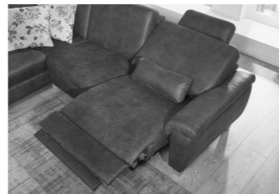
motorische Relaxfunktion wandfrei