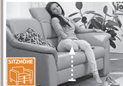
2 Sitzhöhen zur Auswahl