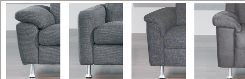
AT 1 AT 2 AT 9 AT 10