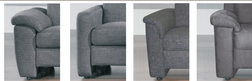
AT 1 AT 2 AT 9 AT 10