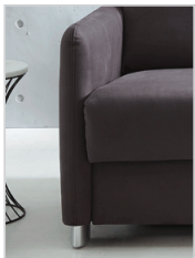
Armlehne Typ 1