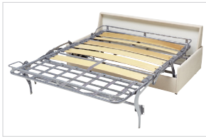
Ergoflex Lattenrost Standard