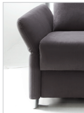
Armlehne Typ 2