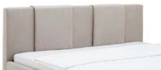
870.00 ab 140 cm ISTANBUL