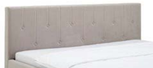
840.00 ab 140 cm ROME