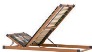
LR40 - 2 Stück & Bodenplatte BP10M