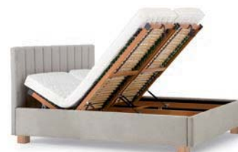
Bettkastenoption nur in Kombination mit dem Fuß „008.41“