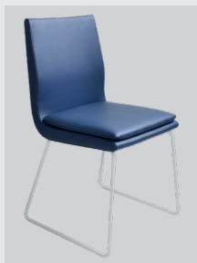
Kufe Metall weiß-matt