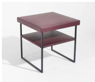
1B Beistelltisch quadratisch hoch mit Zwischenablage