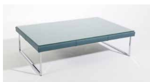
1D Couchtisch rechteckig mit Glasplatte 9D