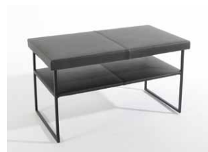
1E Beistelltisch rechteckig hoch