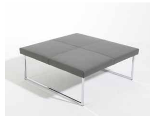
1C Couchtisch quadratisch