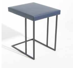
1A Laptoptisch hoch