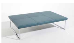
1D Couchtisch rechteckig