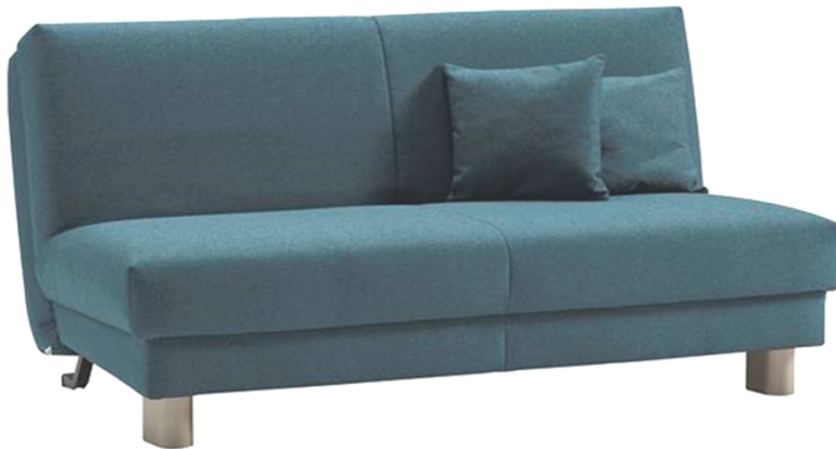
Abbildung: Bezug 30/3258 petrol