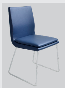
Kufe Metall weiß-matt