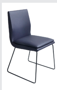
Kufe Metall schwarz Struktur