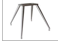
4 Fuß-Gestell oval, konisch