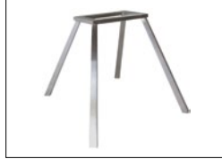
4 Fuß-Gestell eckig, konisch