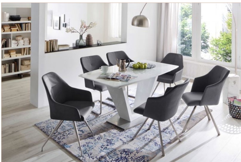
Stuhl & Schwinger MADITA mit Tisch ILKO

Schwingstuhl Rundrohr Edelstahl gebürstet B/H/T ca. 54/88/62 cm VPE: 2