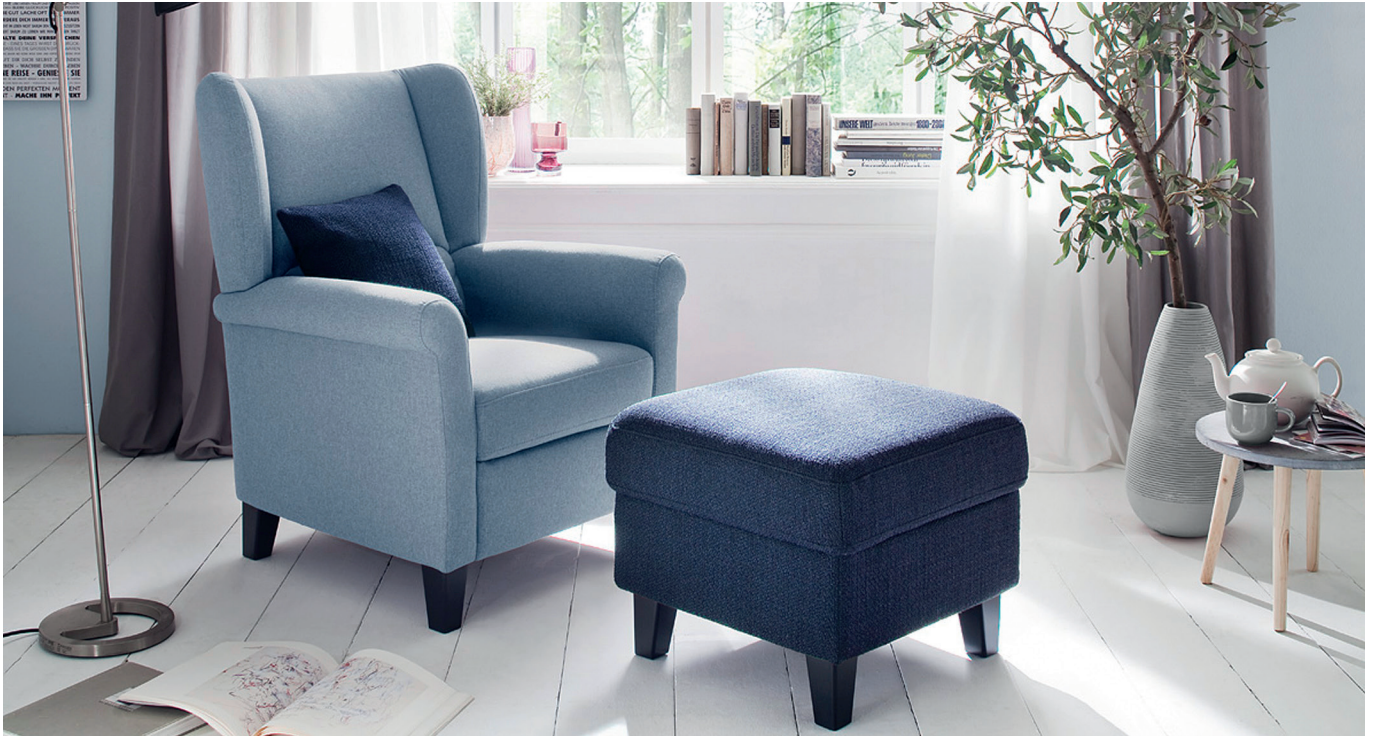
Ohrenbackensessel + Hocker