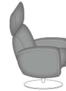
large SH46 / ST52 Rückenhöhe 112 Liegelänge ca. 180 cm

Bitte alle erforderlichen Vorgaben zu einer Bestellung beachten. Beginnen Sie Ihre Angaben mit der davorstehend linken Type. (Bitte Stellskizze mitsenden!)