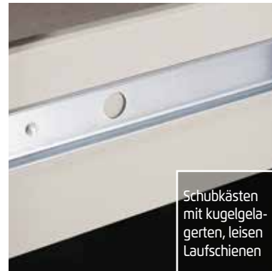
Schubkästen mit kugelgelagerten, leisen Laufschienen