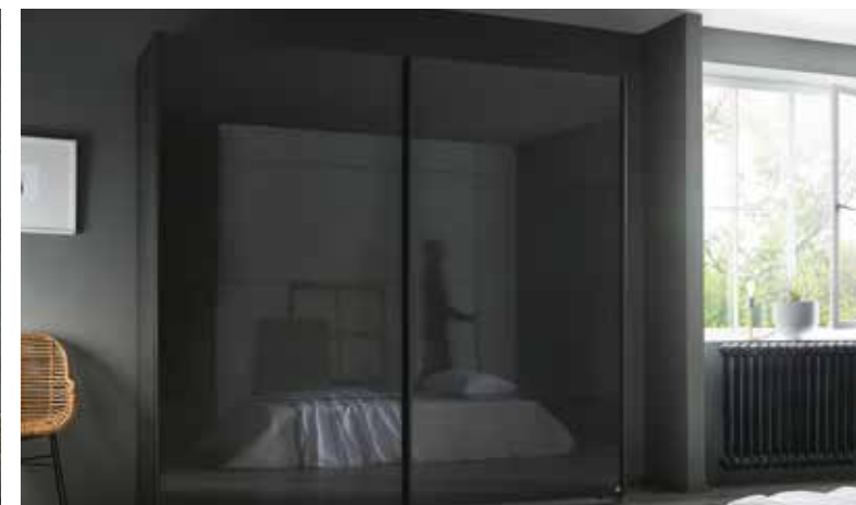
Korpus: A7383 grau-metallic, Griffleisten grau-metallic Front: AD874 Hochglanz Effektgrau