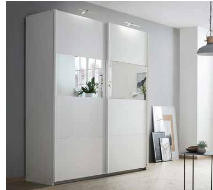
Korpus: A8483 alpinweiß, Griffleisten korpusfarben Front: A9333 alpinweiß, Spiegel