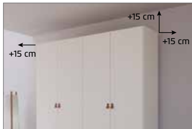
Für die Montage des Schrankes wird folgender Platz benötigt: Schrankhöhe + mind. 15 cm, Schrankbreite + mind. je 15 cm an beiden Seiten.