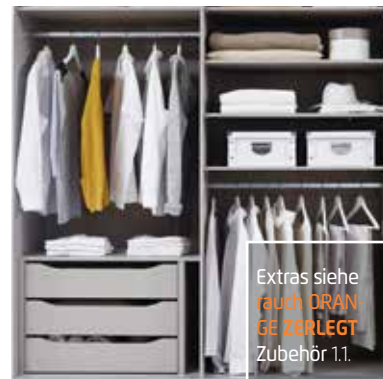
Extras siehe rauch DRANGE ZERLEGT Zubehör 1.1.