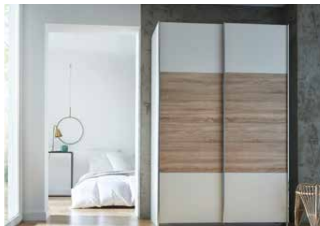
Korpus: AN893 alpinweiß, Griffleisten chromfarben Front: A9333 alpinweiß, AP613 Dekor-Druck Eiche Sonoma