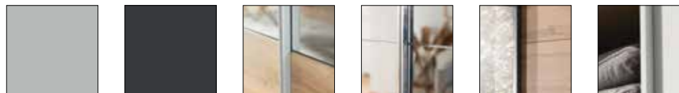
seidengrau grau-metallic alufarben chromfarben grau-metallic korpusfarben