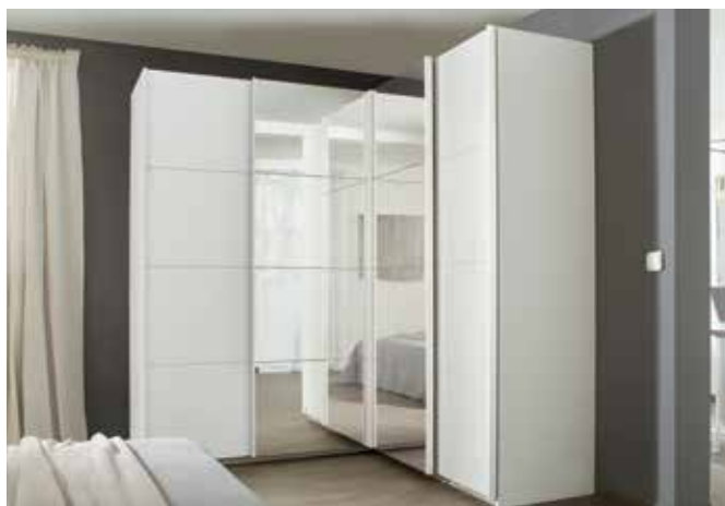
Korpus: A8483 alpinweiß, Griffleisten korpusfarben Front: A9333 alpinweiß, Spiegel