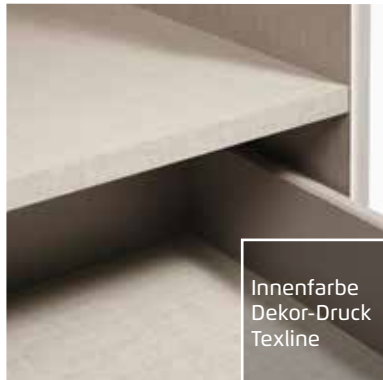
Innenfarbe Dekor-Druck Texline