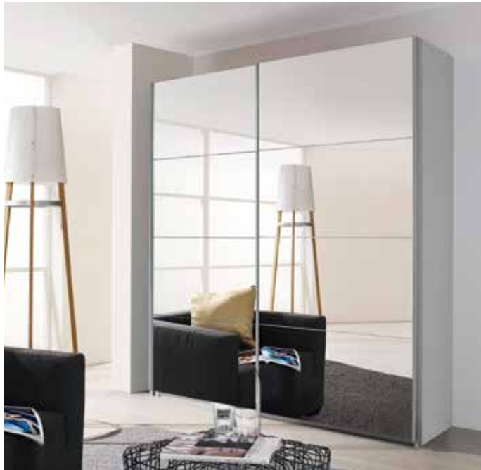
Korpus: A9333 alpinweiß, Griffleisten alufarben Front: A9333 Spiegel