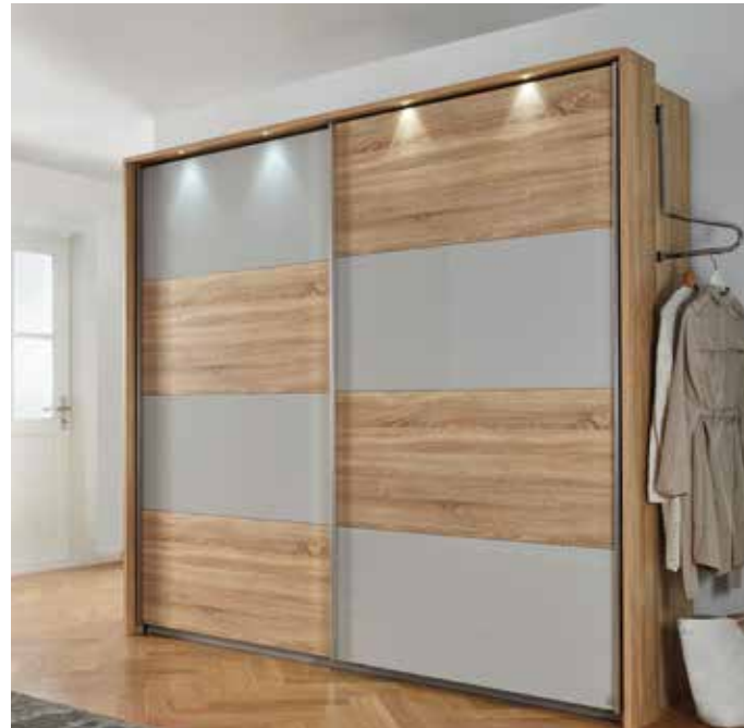
Korpus: AK673 Dekor-Druck Eiche Sonoma, Griffleisten chromfarben Front: AP613 Dekor-Druck Eiche Sonoma, AD204 Glas seidengrau