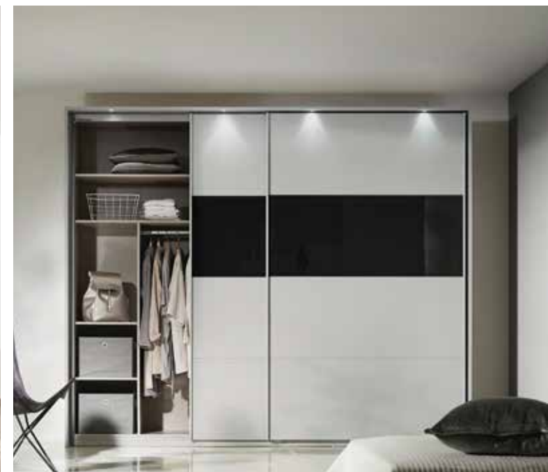
Korpus: AD202 seidengrau, Griffleisten korpusfarben Front: AD289 seidengrau, Glas basalt Passepartout: AD200 seidengrau Zubehör: Inneneinteilung (siehe rauch ORANGE - ZERLEGT Zubehör 1.1)