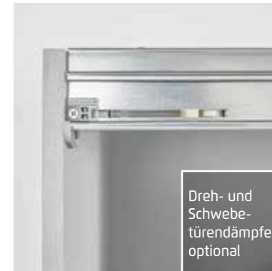
Dreh- und Schwebetürendämpfer optional