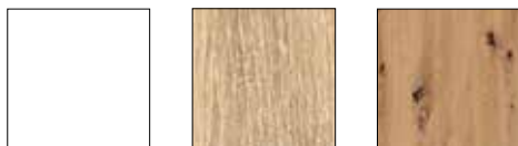
alpinweiß Dekor-Druck Eiche Sonoma Dekor-Druck Eiche Artisan