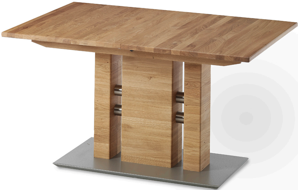
Abbildung 2A Funktionstisch, Massivholz Wildeiche natur geölt