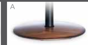
Holzteller in Buche (Farbe lt. Beiztonkarte)