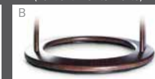
Holzdrehring in Buche (Farbe lt. Beiztonkarte)