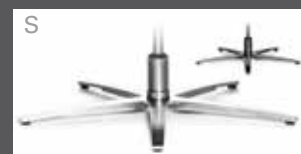
Metall-Sternfuß schmal - verchromt - Edelstahloptik - Anthrazit (pulverbeschichtet)