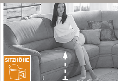
3 Sitzhöhen zur Auswahl

3 Sitzhöhen durch unterschiedlich hohe Möbelgleiter. Nicht möglich bei Funktionselementen. Dadurch ändert sich auch die Rückenhöhe.