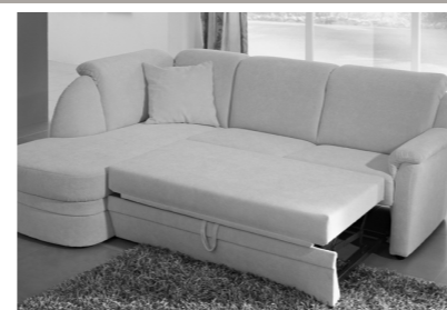
Querschläfer (Mehrpreis, Auszug ist optional im Originalbezug (echt) möglich)