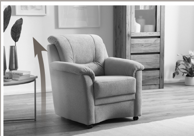
Niedrige Rückenhöhe Ideal für Stellplatz unter Fenster oder Dachstrahlen!