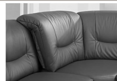
Winkelecke mit Funktion