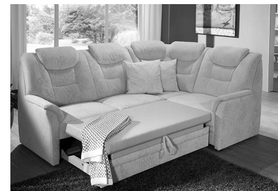
Querschläfer (Mehrpreis, Auszug ist optional im Originalbezug (echt) möglich)