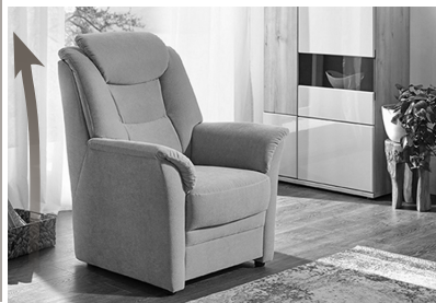
Extra hohe Rückenlehne