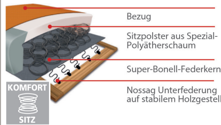
Komfortsitz mit Federkern