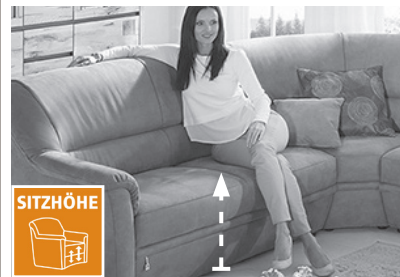
3 Sitzhöhen zur Auswahl

3 Sitzhöhen durch unterschiedlich hohe Möbelgleiter. Nicht möglich bei Funktionselementen. Dadurch ändert sich auch die Rückenhöhe.