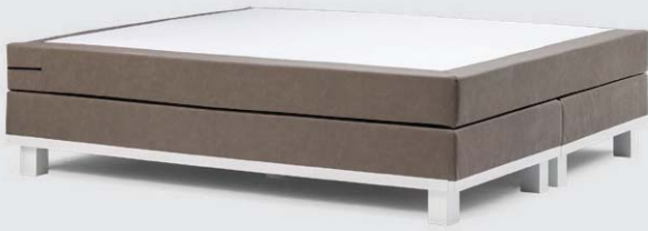
BST1.00-06-03-F90 Matratzenbezug: BS18VB-F90 Matratzen Härtegrad: H2/H3