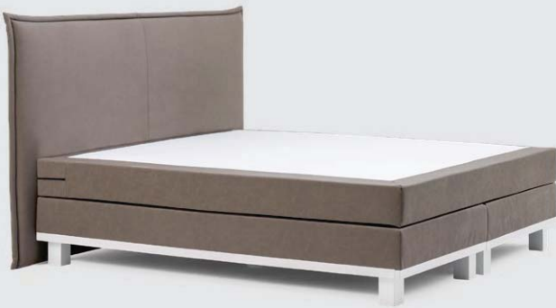
BST2.00-06-03-F90 Matratzen Härtegrad: H2/H3 Matratzenbezug: BS18VB-F90