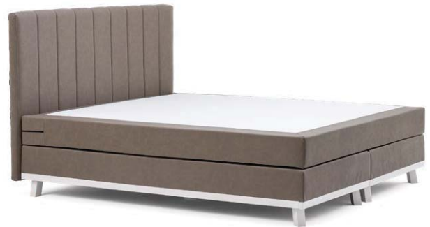
BSM2.02-06-03-F90 Matratzen Härtegrad: H2/H3 Matratzenbezug: BS18VB-F90