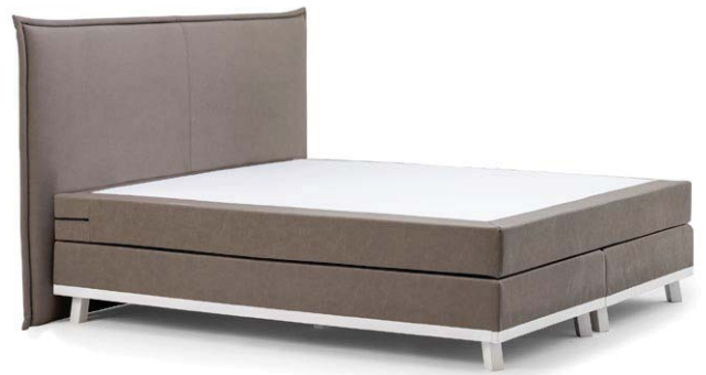
BST2.02-06-03-F90 Matratzen Härtegrad: H2/H3 Matratzenbezug: BS18VB-F90