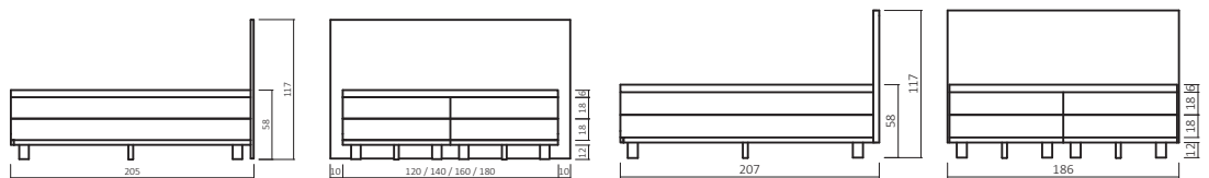
BST2.00 / TRENDI T