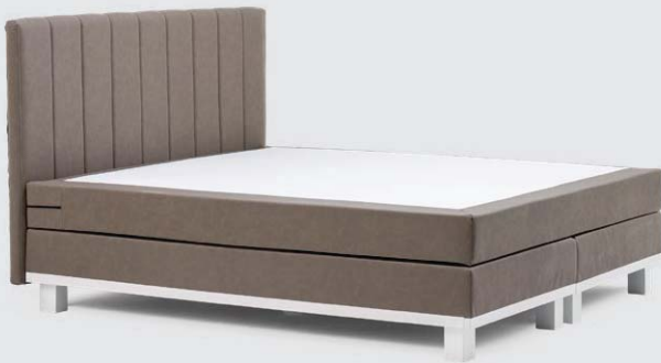
BSM2.00-06-03-F90 Matratzen Härtegrad: H2/H3 Matratzenbezug: BS18VB-F90