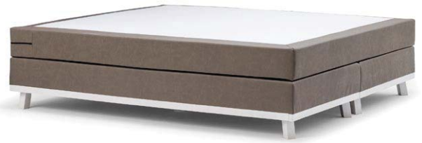
BST1.02-06-03-F90 Matratzenbezug: BS18VB-F90 Matratzen Härtegrad: H2/H3