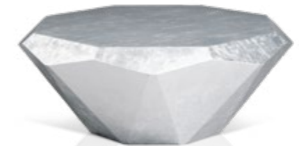
R 145 S ▶ 103 cm ▼ 103 cm ▲ 40 cm