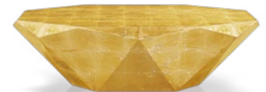
J 145 G ▶ 138 cm ▼ 78 cm ▲ 40 cm