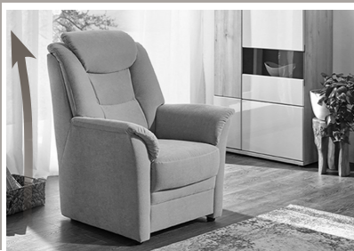
Extra hohe Rückenlehne