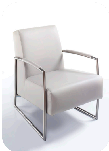
1A Einzelsessel mit Kappnaht