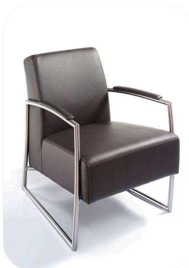
1B Einzelsessel mit Steppnaht