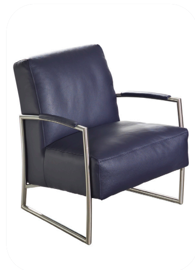
1D Einzelsessel mit Inlettauflege

ACHTUNG! Die Inlettauflege verleiht diesem Sessel seinen betont softigen Sitz.