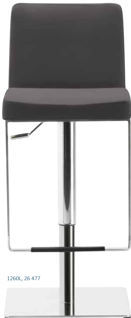
1260L, 26 477

(nur Ausführungen 26 476 / 26 477 / 26 478)