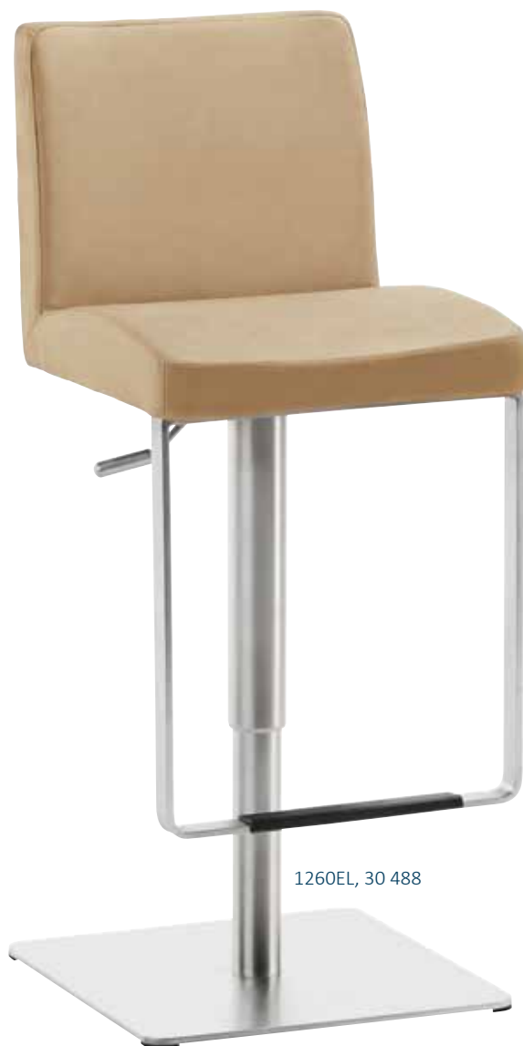
1260EL, 30 488