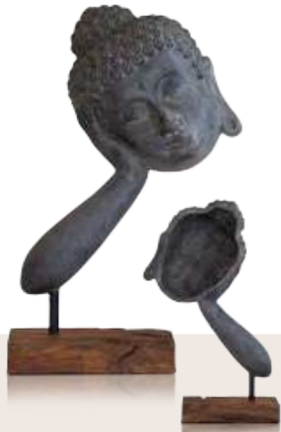
Shaolin Mönch in zwei Größen