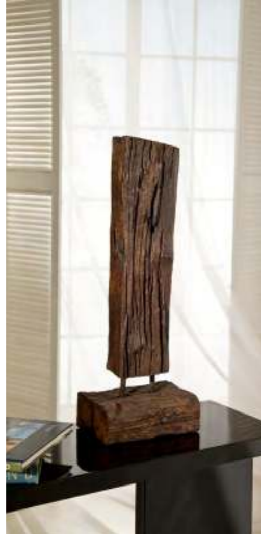
Art.-Nr. RWS 1000

Bahnschwelle Höhe: ca. 100 cm, Breite: ca. 25 cm