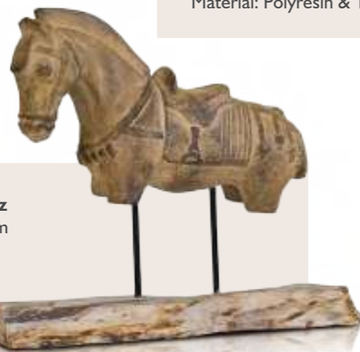
Art.-Nr. F 1000

Ammonit on Stand B 42 - 44 H 58 T 16 cm (ca.) Material: Polyresin & Teakholz