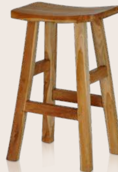
Stehtische „von natürlichem Wuchs“

Barhocker aus Wurzelholz B 50 H 76 T 38,5 cm