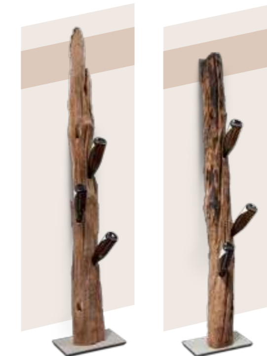
Art.-Nr. WS 1800

U-Balken: Höhe 200 cm, Breite 18 cm, Tiefe 10 cm, Gesamttiefe incl. Fuß 38 cm. Circa 7° Wandschräge, daher nur oben anliegend. Wand- befestigung (oben) hinten eingelassen. Für 9 Weinflaschen. Fuß: Alu-Platte 40 x 20 cm, zum Ausgleich von Uneben- heiten mit Füßchen in der Höhe verstellbar.