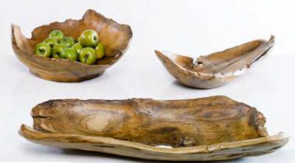
Art.-Nr. TFS 500

Teakholz Flachschaale länglich Länge: ca. 50 cm