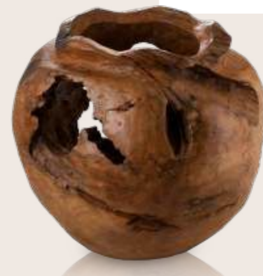
Art.-Nr. TV 500