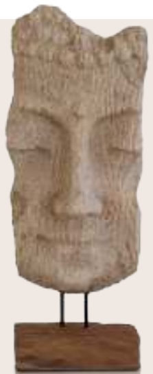
Art.-Nr. F 1004

Half Face on Stand B 23 H 68 T 16 cm (ca.) Material: Polyresin und Teakholz