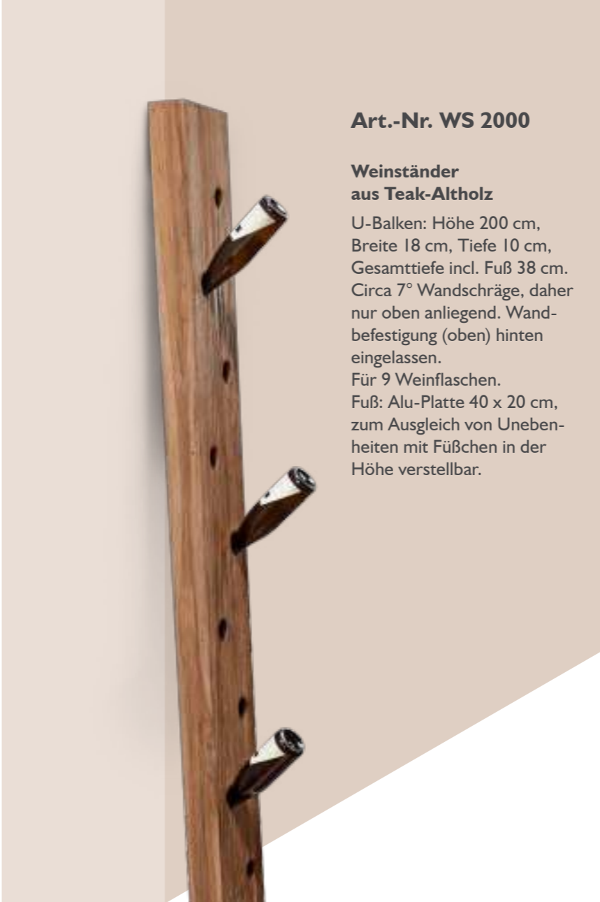
Art.-Nr. WS 2000

Bahnschwelle Höhe: ca. 180 cm Breite: ca. 25 cm