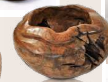
Art.-Nr. TG 400

Teakholz Gefäß Ø ca. 40 cm, Höhe: ca. 25 cm