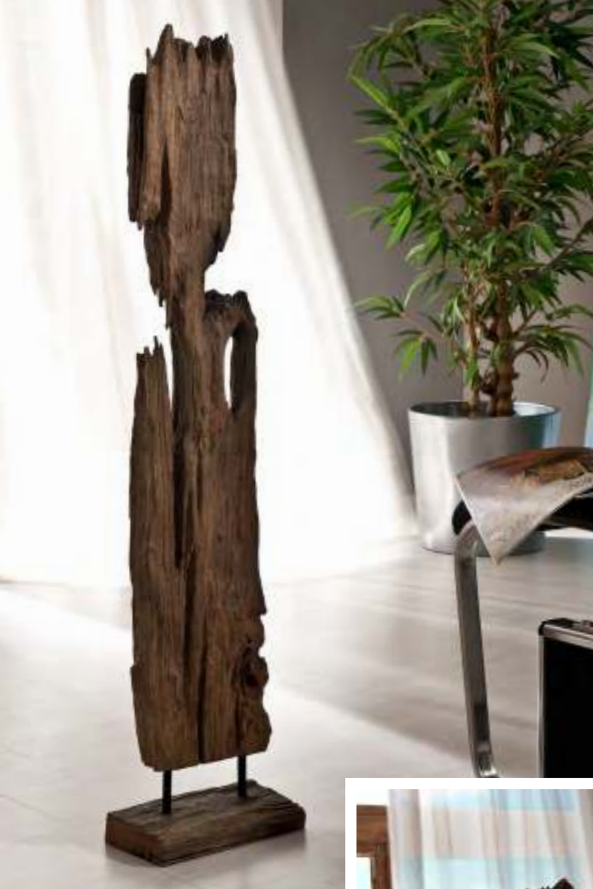
Art.-Nr. TW 1000

Teakholz Wurzel Höhe: ca. 100 cm, Breite: ca. 25 cm