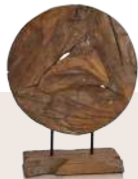
Art.-Nr. F 1006