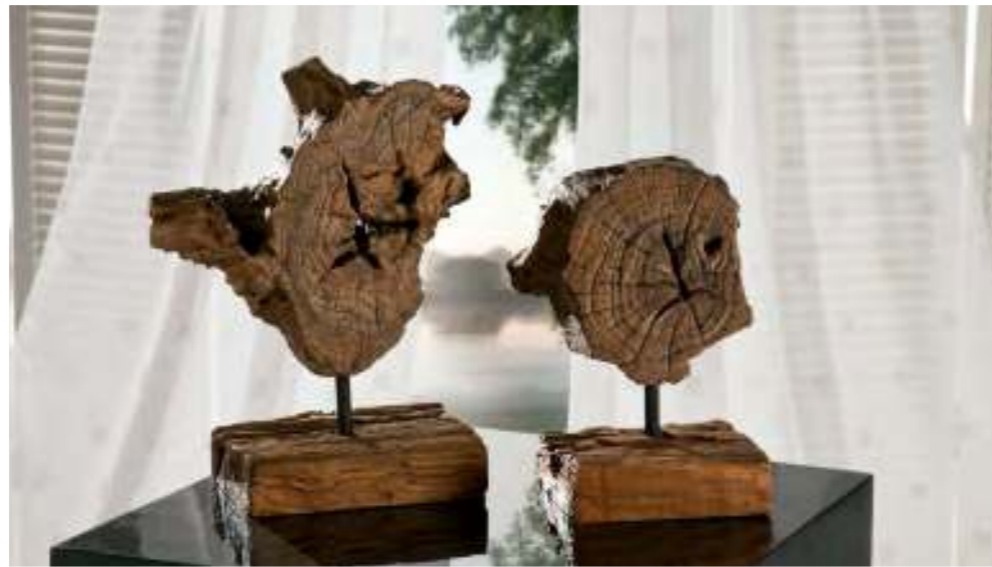
Art.-Nr. AWS 250

Bahnschwelle Höhe: ca. 60 cm, Breite: ca. 25 cm