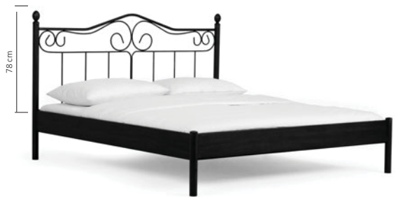
214.03 (ist ab 140 cm lieferbar) PALERMO