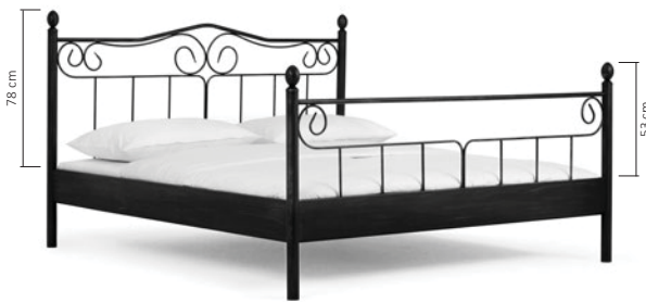
214.00 (ist ab 140 cm lieferbar) ZYPERN