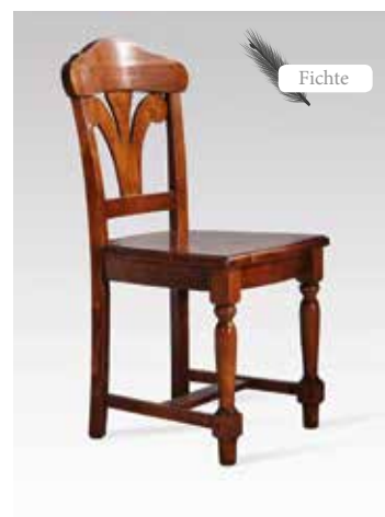
VALENTINA 2531 B/H/T 47x91x51 Abbildung: bassano lackiert mit Gebrauchsspuren