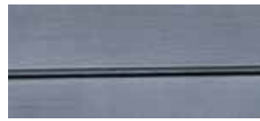
④ florettsilber lackiert P