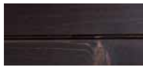
② wenge lackiert