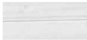
① weiß gewachst