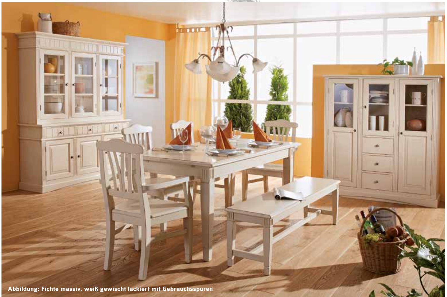
Abbildung: Fichte massiv, weiß gewischt lackiert mit Gebrauchsspuren