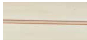
④ weiß gewischt lackiert mit Gebrauchsspuren P