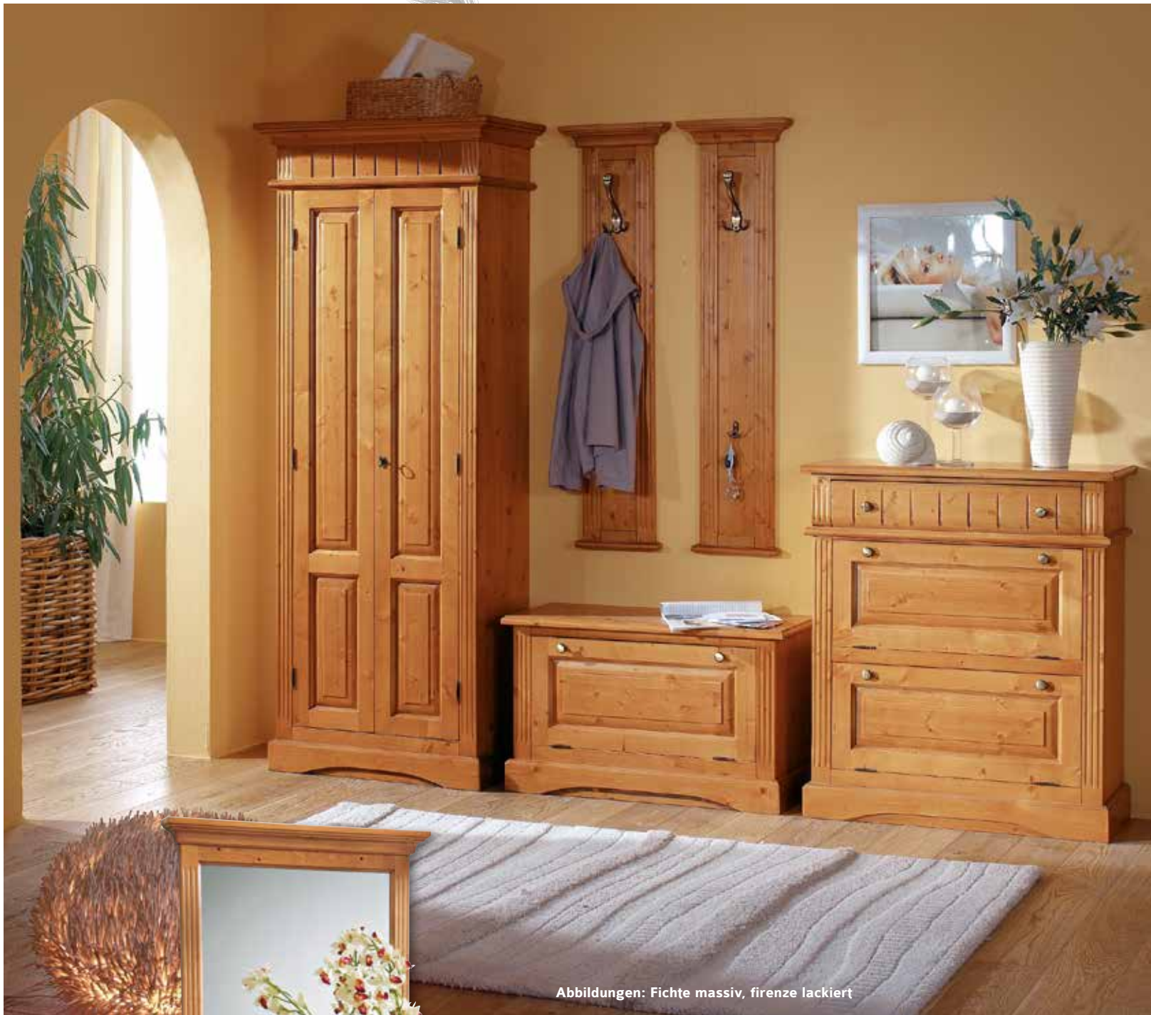
Abbildungen: Fichte massiv, firenze lackiert