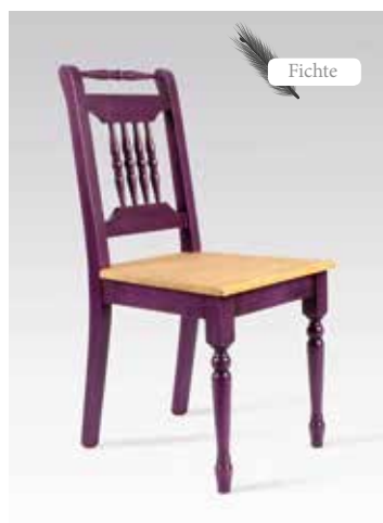
ALINA 1431 B/H/T 43x90x54 Abbildung: violett lackiert, Sitzfläche antik gewachst