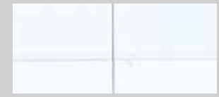
④ weiß deckend lackiert