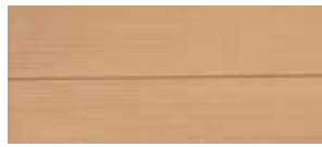
① natur gewachst