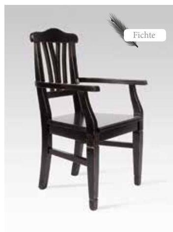
LARA-Foyer 2232 B/H/T 55x99x54 Abbildung: schwarz Kirschbaum lackiert