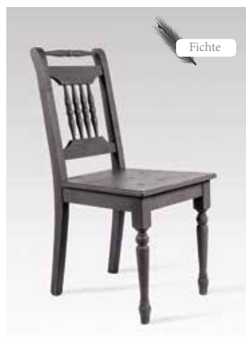
ALINA 1431 B/H/T 43x90x54 Abbildung: delphingrau lackiert