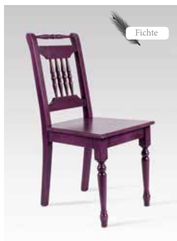
ALINA 1431 B/H/T 43x90x54 Abbildung: violett lackiert