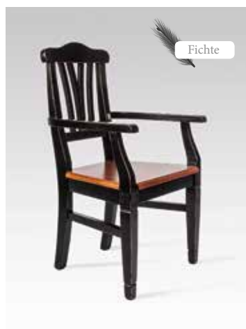
LARA-Foyer 2232 B/H/T 55x99x54 Abbildung: schwarz Kirschbaum lackiert, Sitzfläche Kirschbaum lackiert