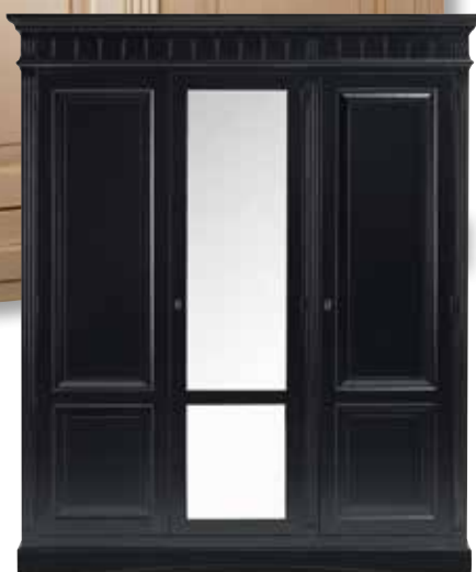
Abbildung: schwarz Kirschbaum lackiert, und einer Spiegelfüllung (preisgleich)

Etliche Sonderanfertigungen auf Anfrage erhältlich.