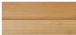
② naturmatt lackiert