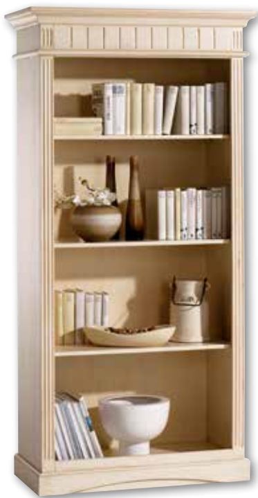
Regal 2260 3 Einlegeböden B 100 / H 201 / T 48 cm Abbildung: weiß gewischt lackiert mit Gebrauchsspuren