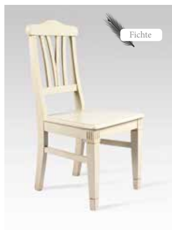
LARA-Foyer 2231 B/H/T 46x99x52 Abbildung: weiß gewischt mit Gebrauchsspuren