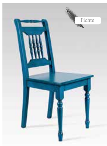
ALINA 1431 B/H/T 43x90x54 Abbildung: scubablau lackiert