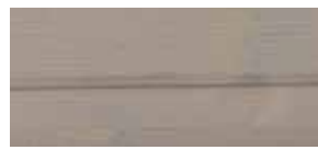
① grau gewachst