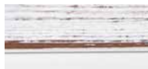
④ vintage lackiert