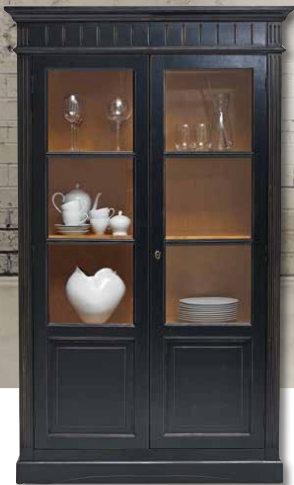
Lara-Foyer Vitrine 2262 3 Einlegeböden B 120 / H 201 / T 48 cm Zum Beispiel schwarz Kirschbaum lackiert