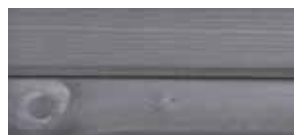
② delphingrau lackiert