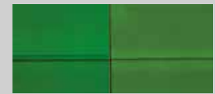
④ aragrün lackiert P