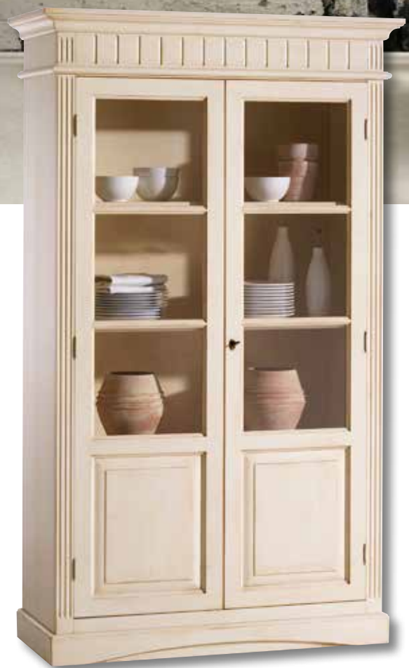
Lara-Foyer Vitrine 2262 Zum Beispiel weiß gewischt lackiert mit Gebrauchsspuren.