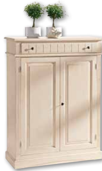
Vertiko 2265 2 Einlegeböden B 110 / H 145 / T 43 cm Abbildung: weiß gewischt lackiert mit Gebrauchsspuren