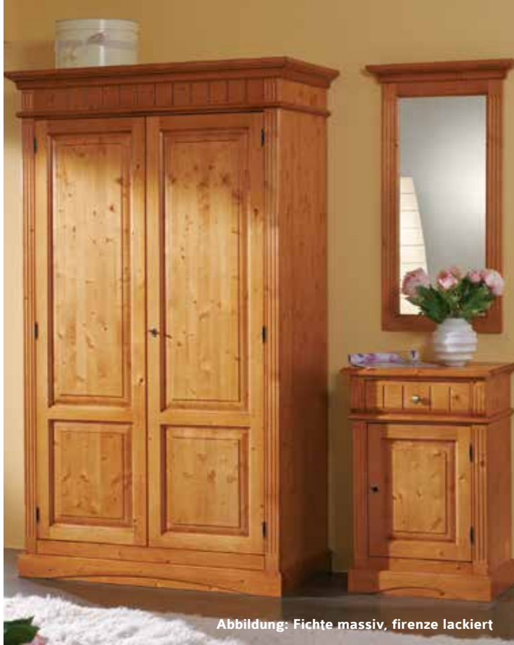
Abbildung: Fichte massiv, firenze lackiert