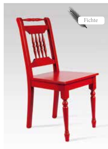
ALINA 1431 B/H/T 43x90x54 Abbildung: rosso tinto lackiert