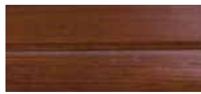
③ Nussbaum lackiert P