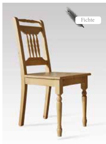
ALINA 1431 B/H/T 43x90x54 Abbildung: naturmatt lackiert

Hier finden Sie eine kleine Auswahl von vielen verschiedenen Möglichkeiten für Ihre ganz individuelle Farbgestaltung.