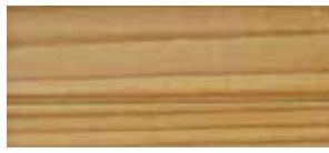
① honig gewachst

Die emotionale Kraft erschließt sich nicht zuletzt aus der Faszination des GRADEL 2.6-Farbkaleidoskops. Bitte beachten Sie, dass die Abbildungen nicht farbverbindlich sind und sich in der Realität Abweichungen vom Druckbild nicht ausschließen lassen.