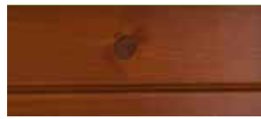
③ Kirschbaum lackiert