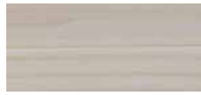
④ bottosso lackiert P