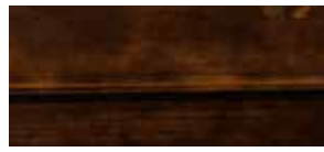
④ bassano lackiert mit Gebrauchsspuren P