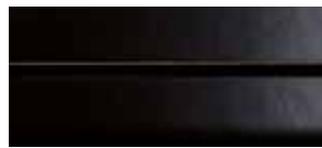
④ schwarz Kirschbaum lackiert