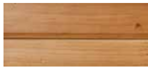
③ antik lackiert