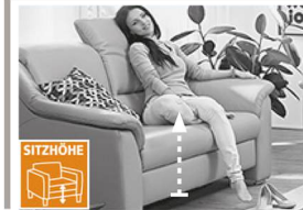
2 Sitzhöhen zur Auswahl