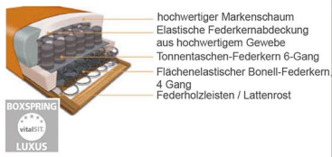
Boxspring Sitz mit Bonell-Federkern und Tonnentaschenfederkern