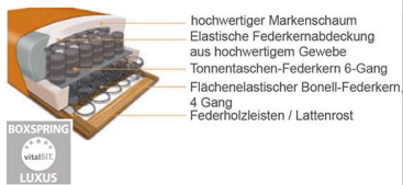
Boxspring Sitz mit Bonell-Federkern und Tonnentaschenfederkern