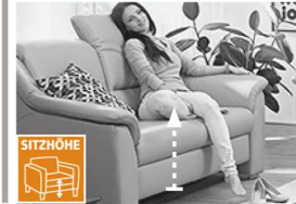
2 Sitzhöhen zur Auswahl