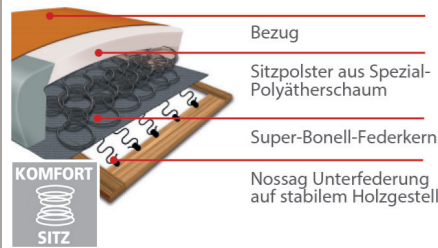
Komfortsitz mit Federkern