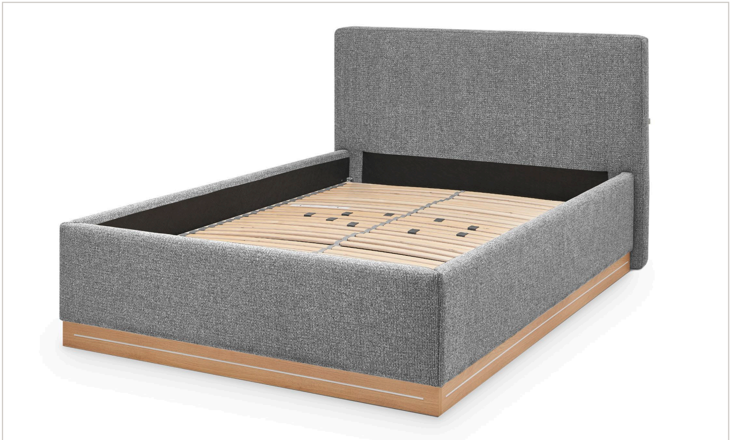
Abb. 2959-89-3000 , NOELLE grau Nr. 09, Kopfteil KT 2 glatt, Sockel S 1 eichefarbig, Liegefläche 140 x 200 cm