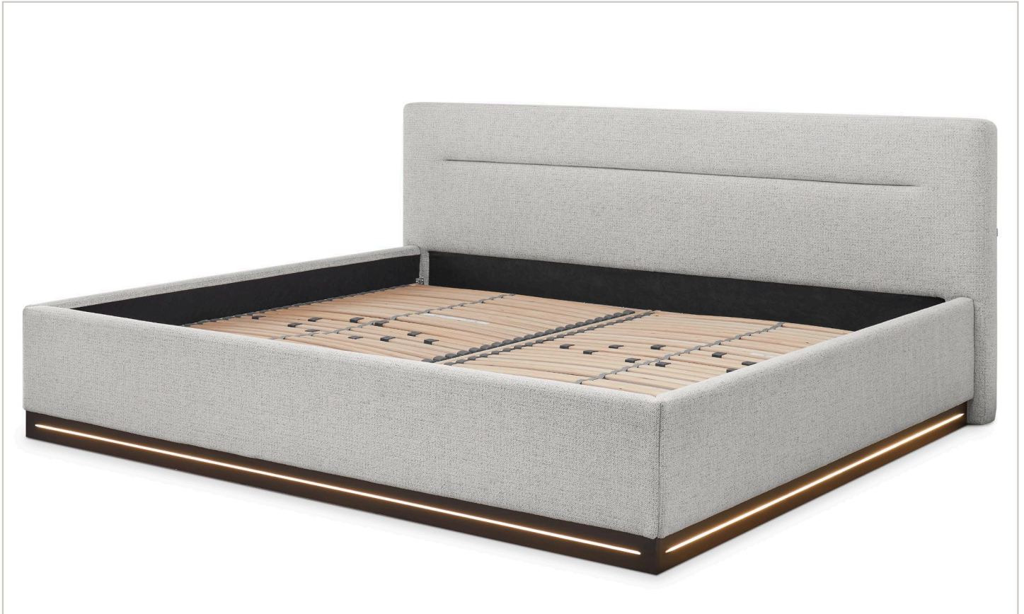
Abb. 2961-88-8000 , NOELLE hellgrau Nr. 04, Kopfteil KT 3 mit Quereinzug, Bettgestell inkl. Bettkasten und Federholzrahmen, Sockel S 2 schwarz, Liegefläche 240 x 200 cm