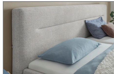
KT 3 Kopfteil mit Quereinzug