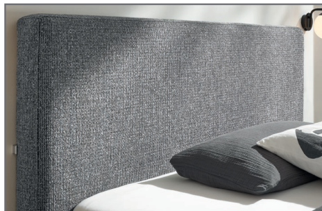
KT 2 Kopfteil glatt