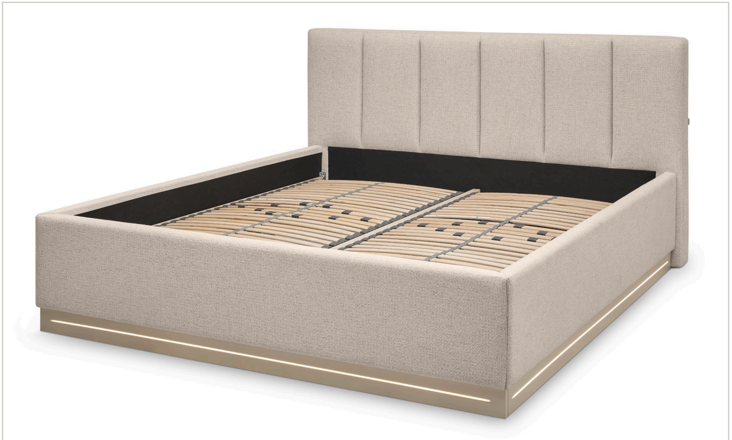
Abb. 2957-87-5000 , NOELLE beige Nr. 30, Kopfteil KT 1 mit senkrechten Einzügen, Bettgestell inkl. Bettkasten und Federholzrahmen, Sockel S 3 sandfarbig, Liegefläche 180 x 200 cm