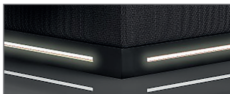
S 2 MDF foliert, schwarz inkl. LED-Beleuchtung, warm-weiß