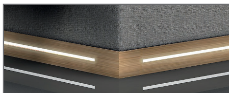
S 1 MDF foliert, eichefarbig inkl. LED-Beleuchtung, warm-weiß