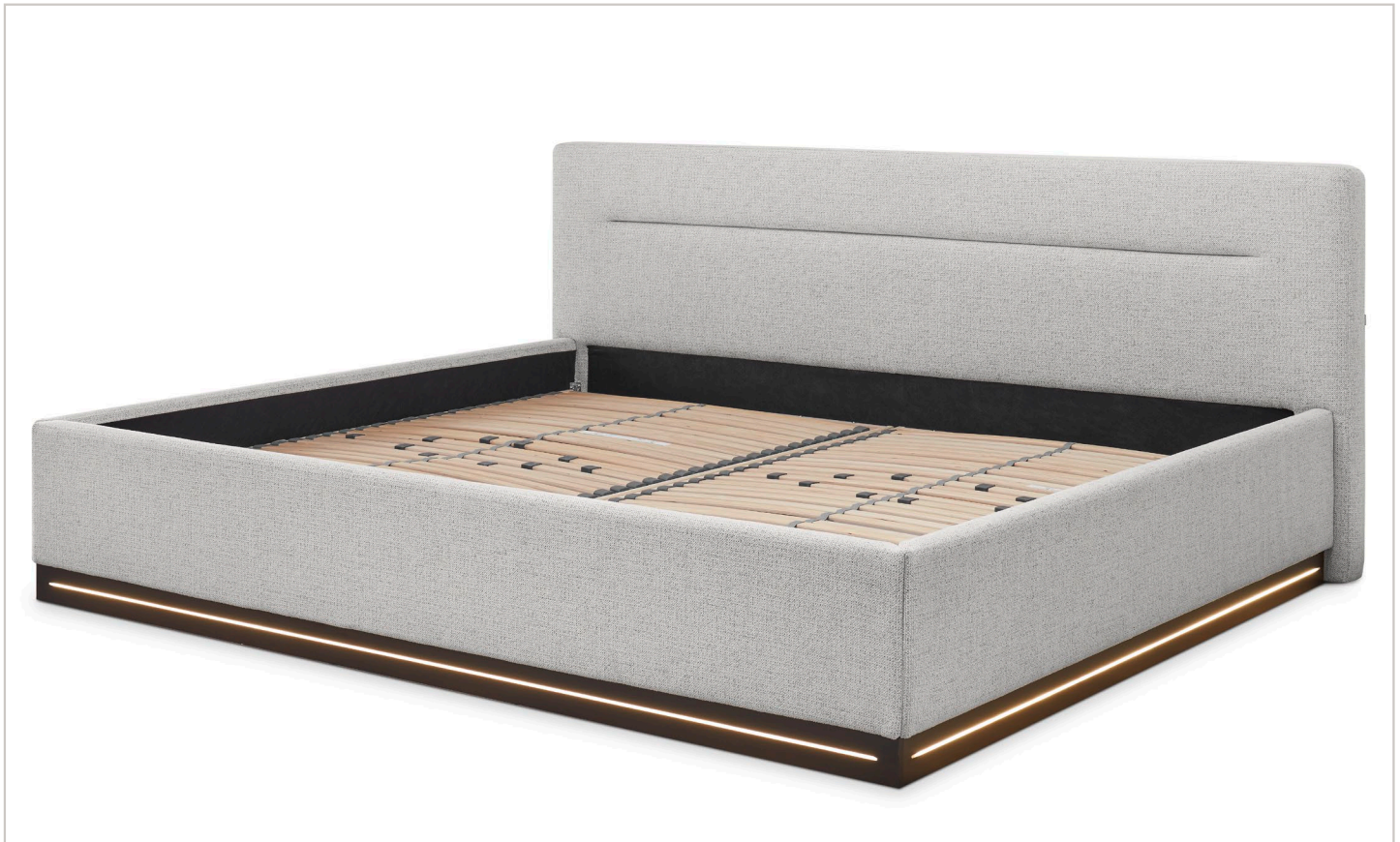
Abb. 2961-88-8000 , NOELLE hellgrau Nr. 04, Kopfteil KT 3 mit Quereinzug, Bettgestell inkl. Bettkasten und Federholzrahmen, Sockel S 2 schwarz, Liegefläche 240 x 200 cm