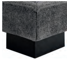
S08-10 S08-15 Sockel schwarz