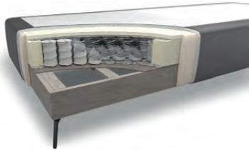
Unterbau „glatt“ mit Taschenfederkern GL25