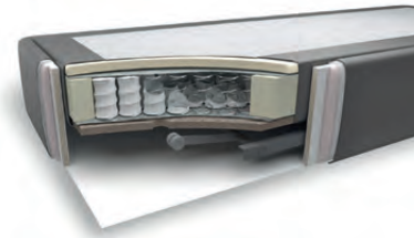
Taschenfederkern mit Motor gegen Aufpreis