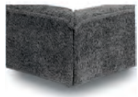
K 08-10 K 08-15 Schwebeoptik