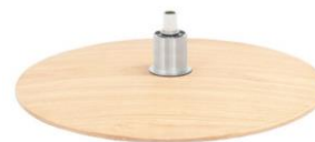
DBE0 Diskfuß Eiche Geölt