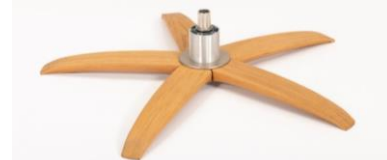
WSG Holzstern Fuß Eiche Geölt