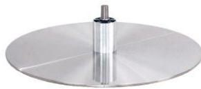
DBB Diskfuß - Metall gebürstet