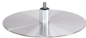
DBB Diskfuß - Metall gebürstet