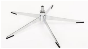
OS Orion Base - Chrom