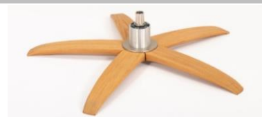
WSG Holzstern Fuß Eiche Geölt