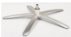
SB Sirius Base - Silver