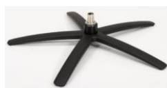
SBS Sirius Base - Schwarz