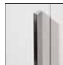
Griffstange/Griff chrom- oder graphitfarben

Passende Extras finden Sie nach den Schränken.