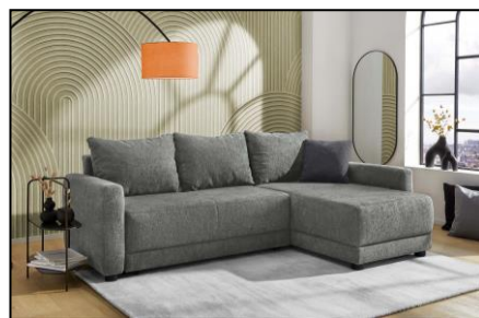
417/39 - 417/39 - 417/09