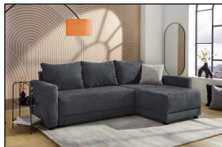
417/09 - 417/09 - 417/19