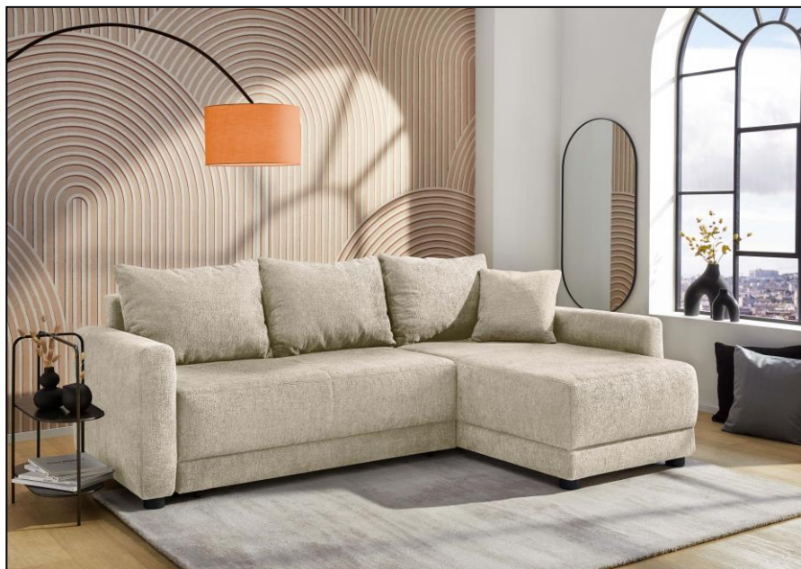
417/07 - 417/07 - 417/07