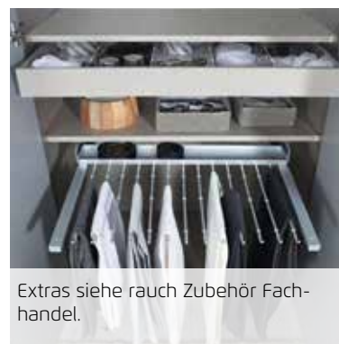
Extras siehe rauch Zubehör Fachhandel.