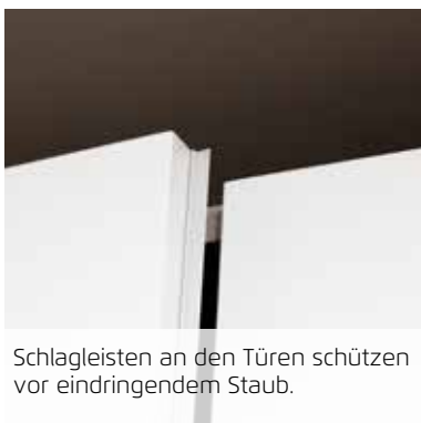
Schlagleisten an den Türen schützen vor eindringendem Staub.