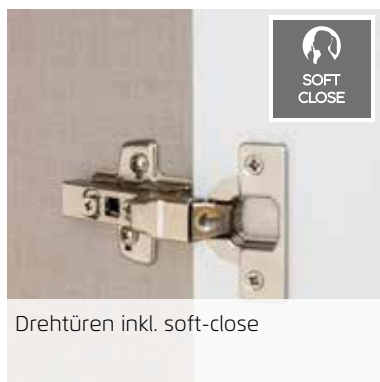
Drehtüren inkl. soft-close