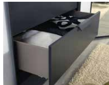
Schubkästen mit Unterflurschiene, Vollauszug, Selbstzienung und Dämpfung.