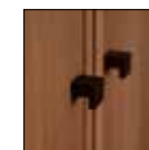
Griffe Deore Bronze