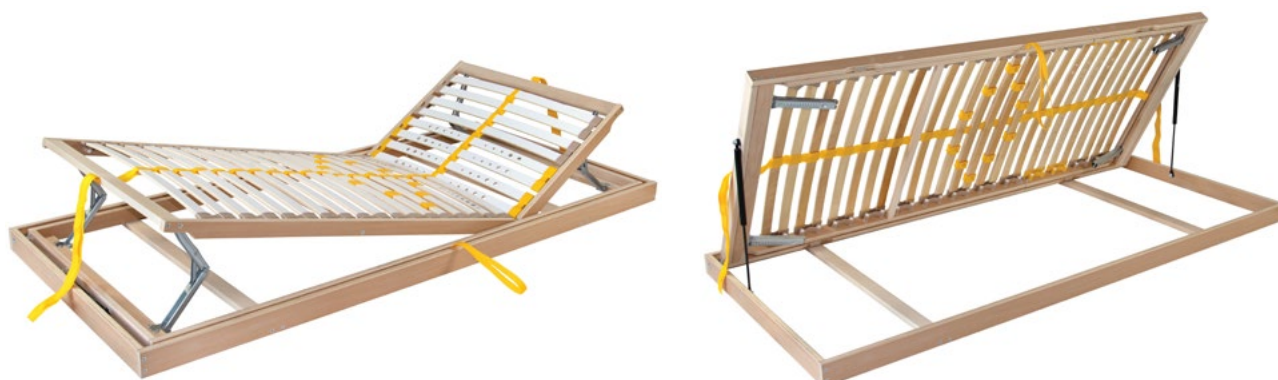
View from the foot of the bed Blick vom Fuß des Bettes