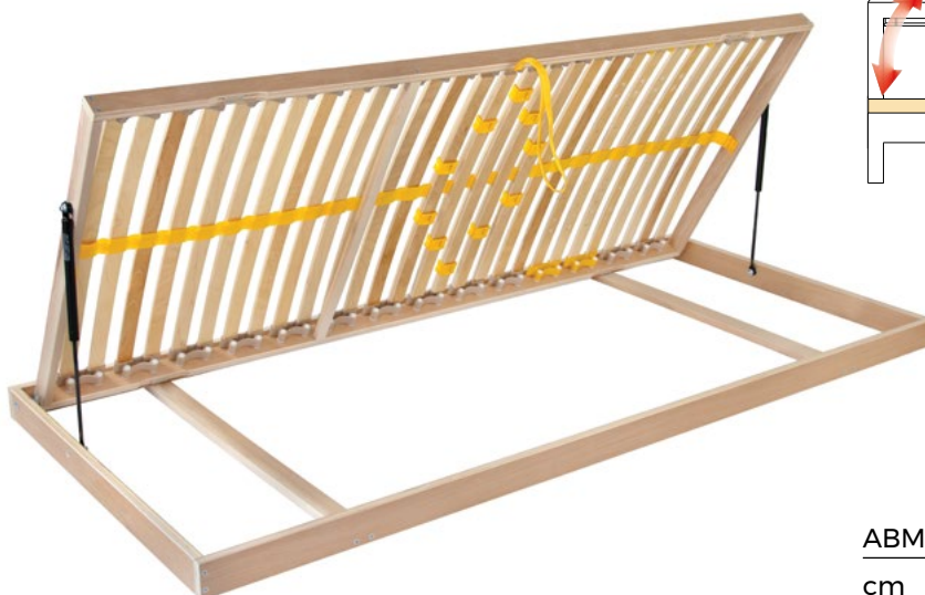
View from the foot of the bed Blick vom Fuß des Bettes