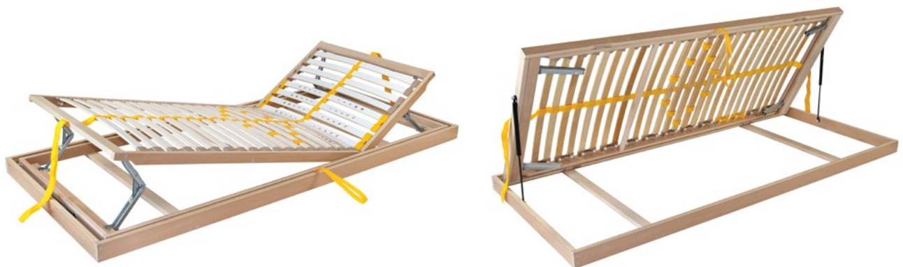
View from the foot of the bed Blick vom Fuß des Bettes