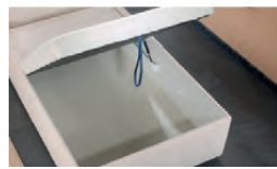
Großraumbettkasten durch aufklappbaren Lattenrahmen