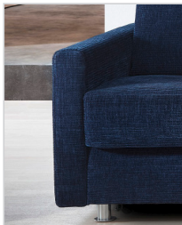
Armlehne Typ 1