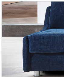
Armlehne Typ 2