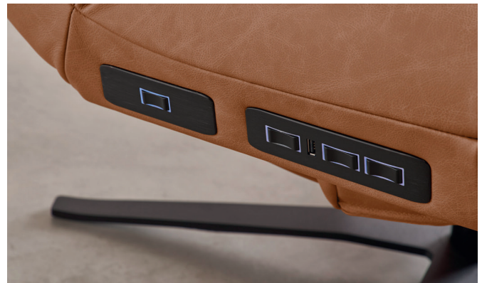
Schalter und USB-Port