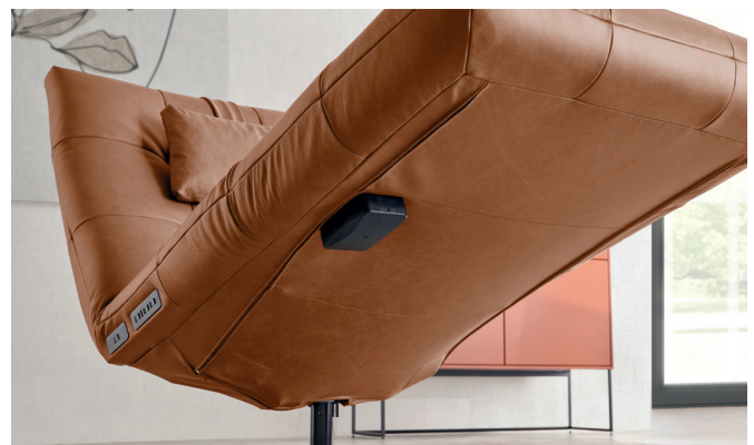
Fußspannteil in Leder echt bezogen