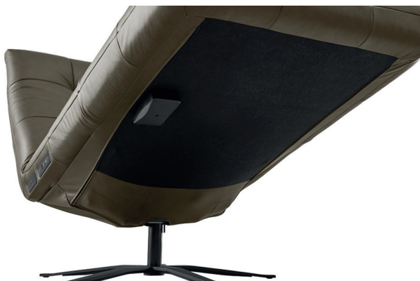
Fußspannteil mit neutralem Stoff