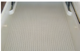
Bodenplatte gelocht für optimale Luftzirkulation