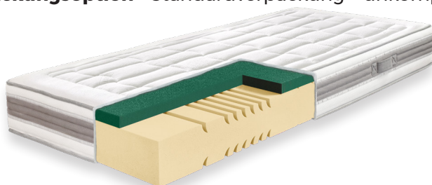
ABMESSUNGEN: LÄNGE | BREITE

Andere Verpackungsoption Standardverpackung = unkomprimierte Matratze, 1x Folienverpackung