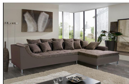
434/18 – 440/09 – 434/18