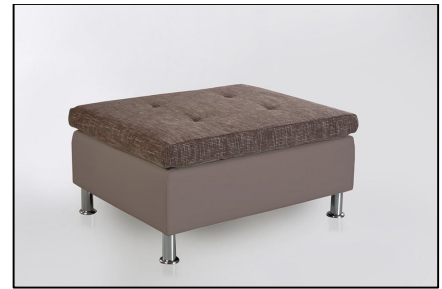
434/18 - 440/09