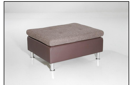
434/08 - 440/08