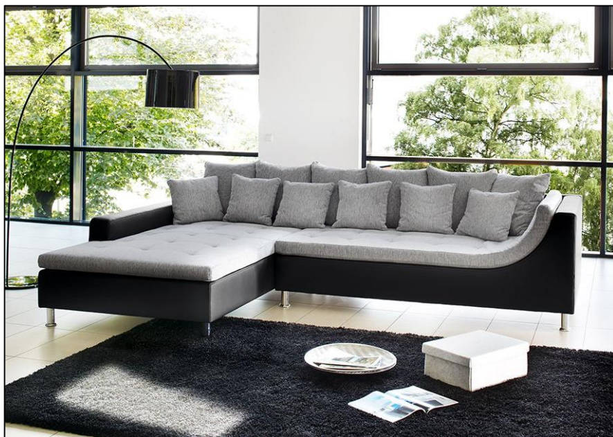
482/09 – 440/16 – 482/09