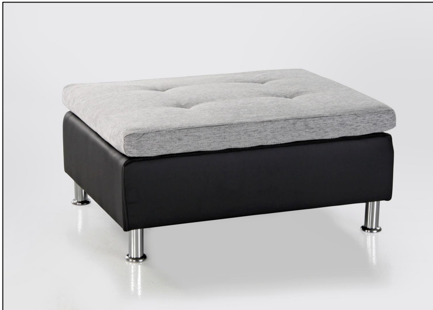
482/09 - 440/16