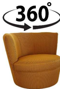
2150-11/DW (mit Drehgestell, 360° drehbar inkl. Wippfunktion)