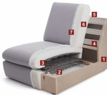
TrendLine Sitzkomfort „MEDIUM“