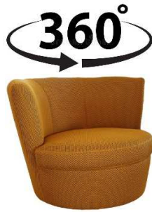
2150-11/D (mit Drehgestell, 360° drehbar)